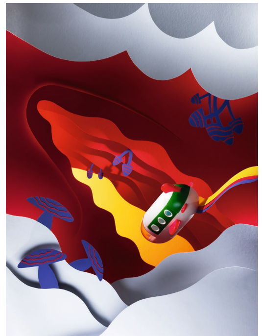
Fina Journey / 2022