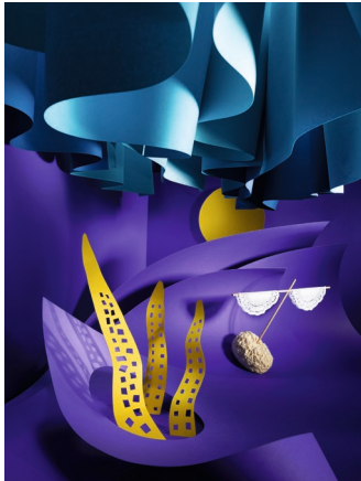
Kraken / 2022

Die Bilder dürfen weder beschnitten noch retuschiert werden. Die Bilddateien müssen aus den Archiven nach Gebrauch entfernt werden. Sollten Sie eine höhere Auflösung benötigen, wenden Sie sich bitte an folgende E-Mail-Adresse: info@demaex.com