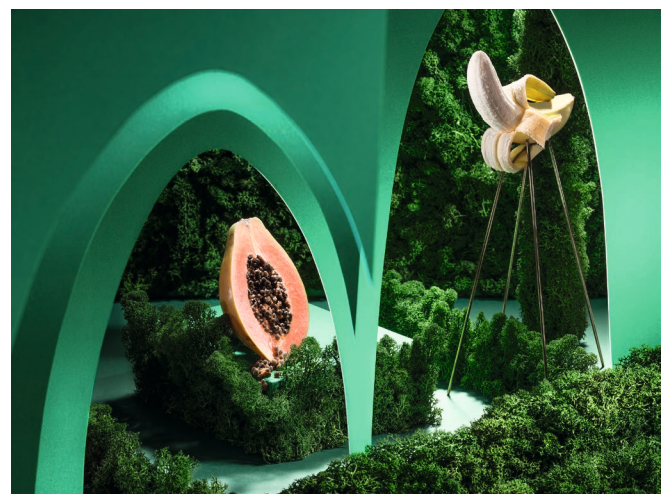
The Garden of Earthly Delights / 2022 © Fabian Dopfer