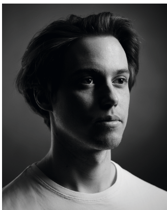
Selbstportrait © Fabian Dopfer