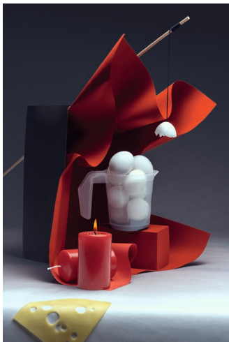
Guernica / 2026 © Fabian Dopfer