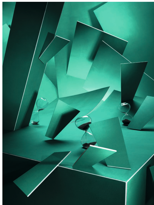
Fear / 2022